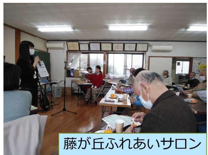
藤が丘ふれあいサロン