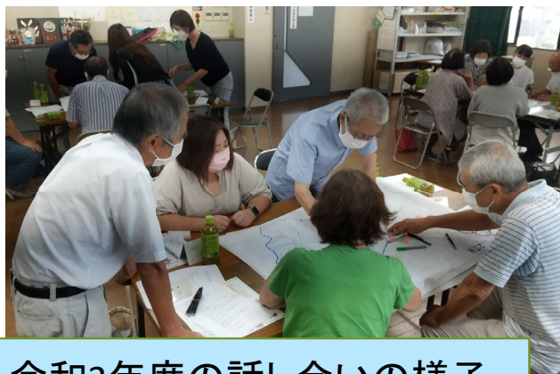
令和3年度の話し合いの様子