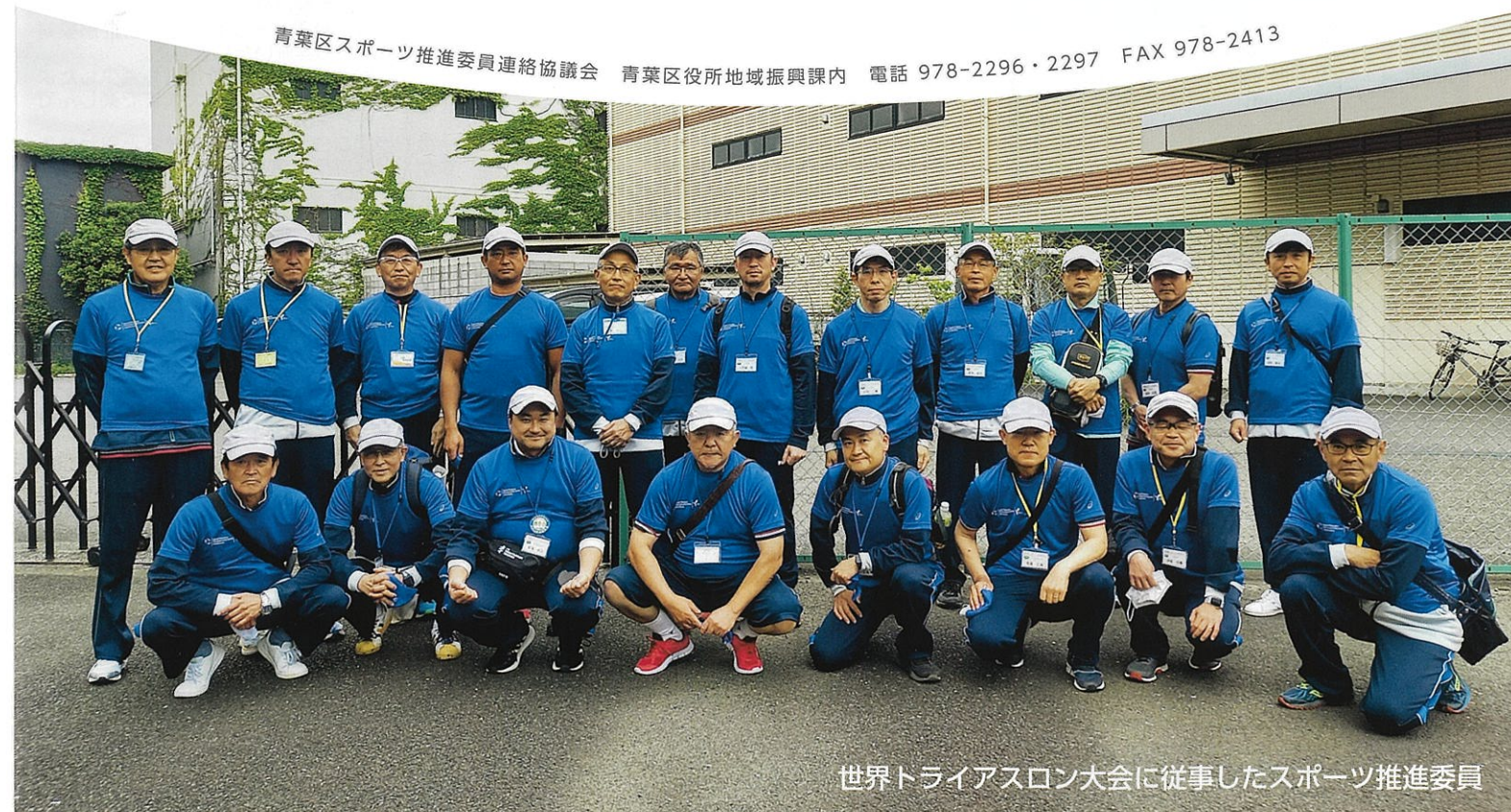
世界トライアスロン大会に従事したスポーツ推進委員

青葉区スポーツ推進委員連絡協議会 青葉区役所地域振興課内 電話 978-2296・2297 FAX 978-2413