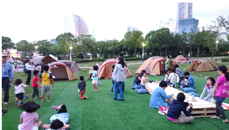
写真:みなとみらい高島中央公園