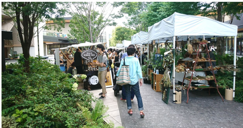
写真:立川グリーンスプリングス(農産物や地域の個店も出店)