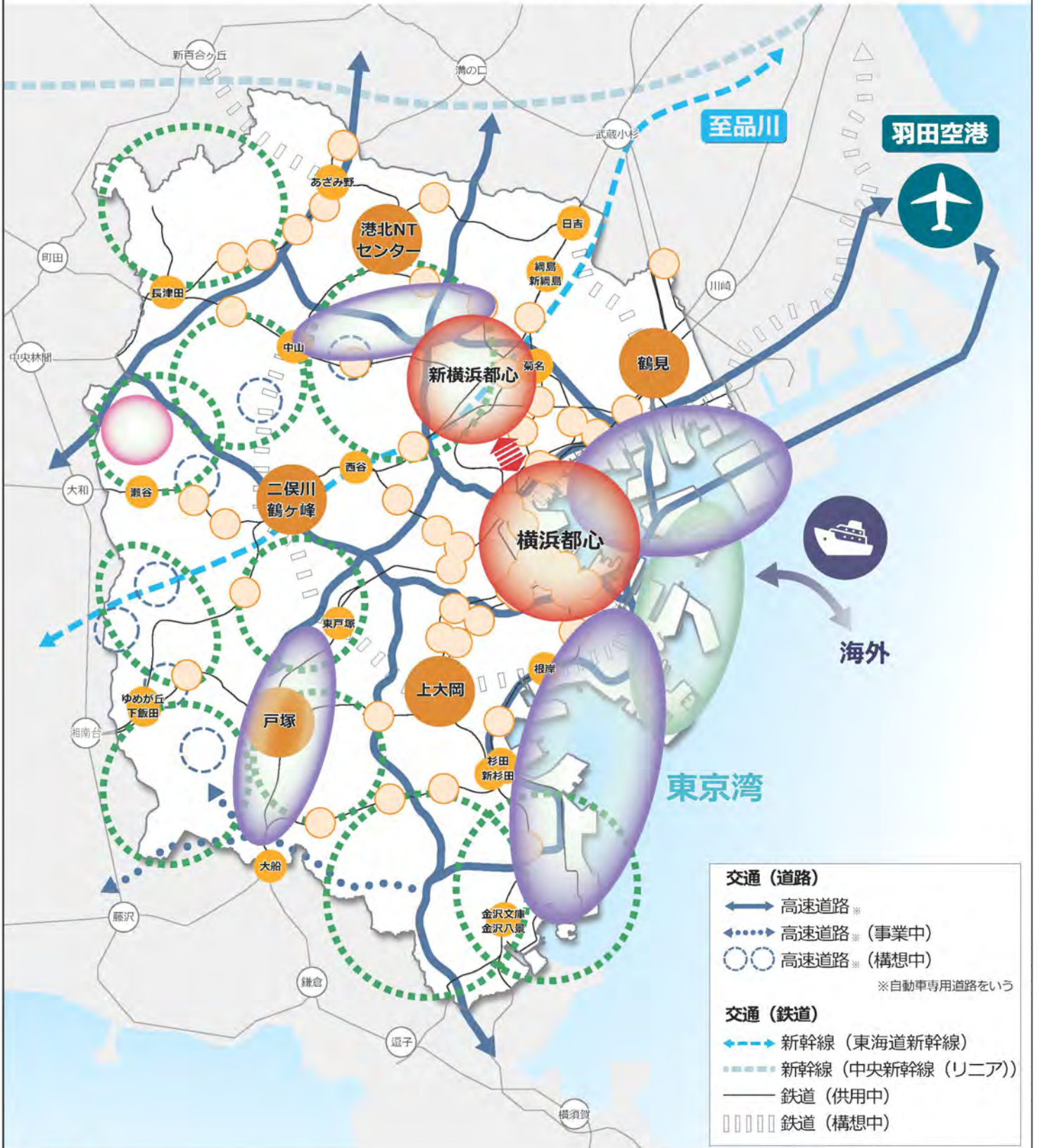
横浜国際港都建設計画 都市計画区域の整備、開発及び保全の方針 附図 1 (1 (4) 都市構造)