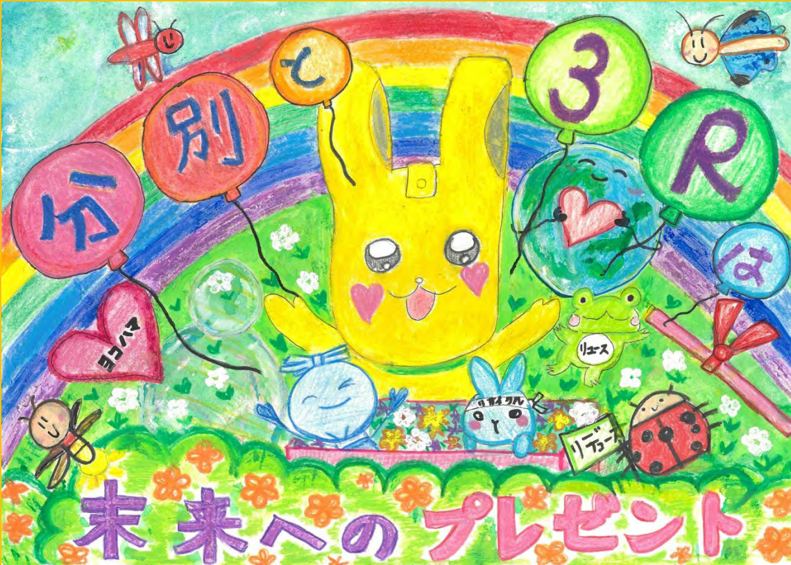
令和6年度 大賞作品 (小学校低学年の部)