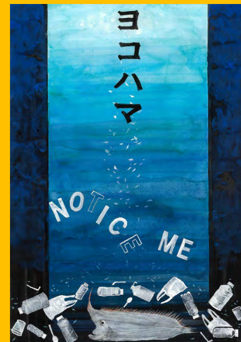
令和6年度 準大賞作品(中学生の部)