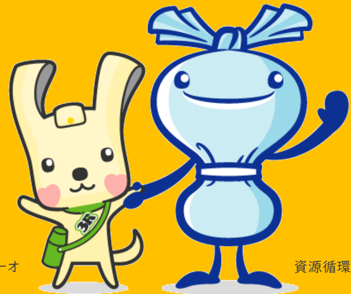
資源循環局マスコットミーオ