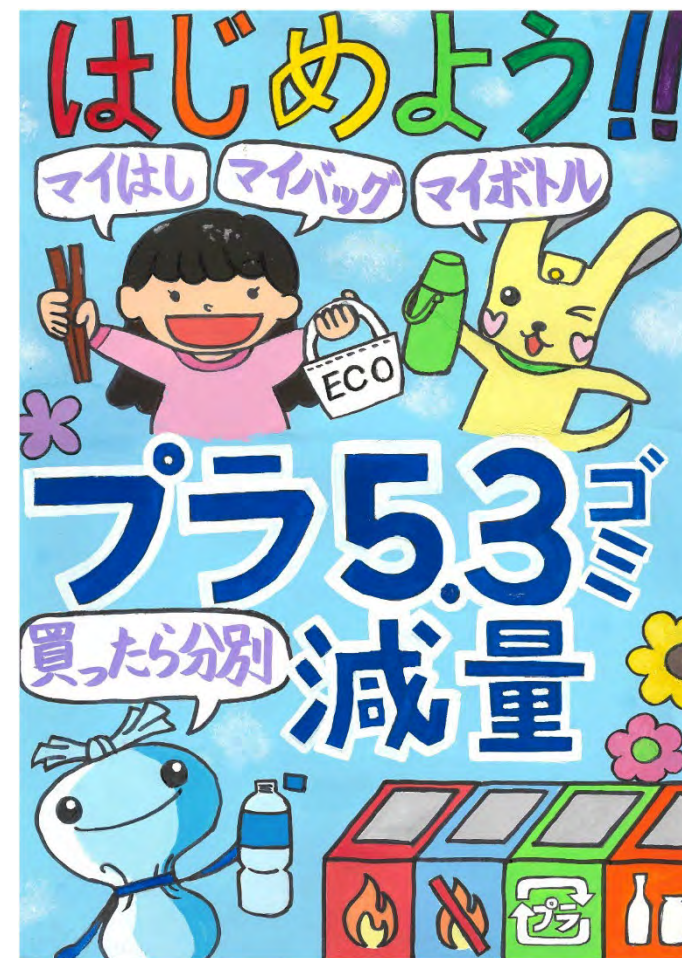
令和6年度 準大賞作品(小学校低学年の部)