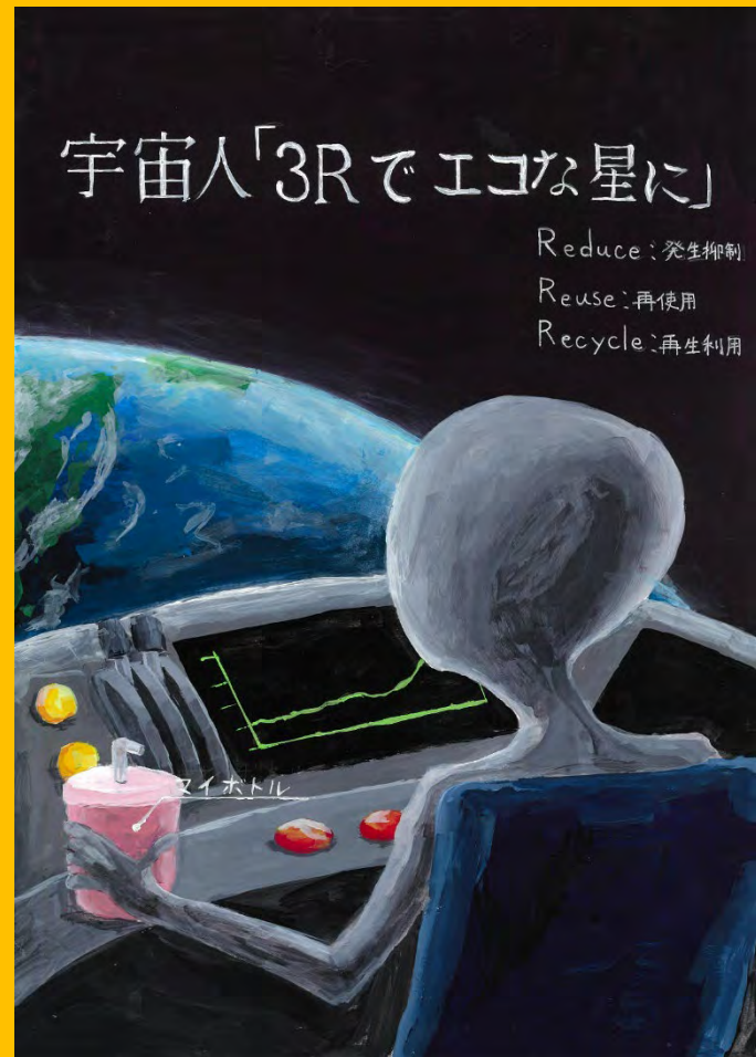
令和6年度 準大賞作品(中学生の部)