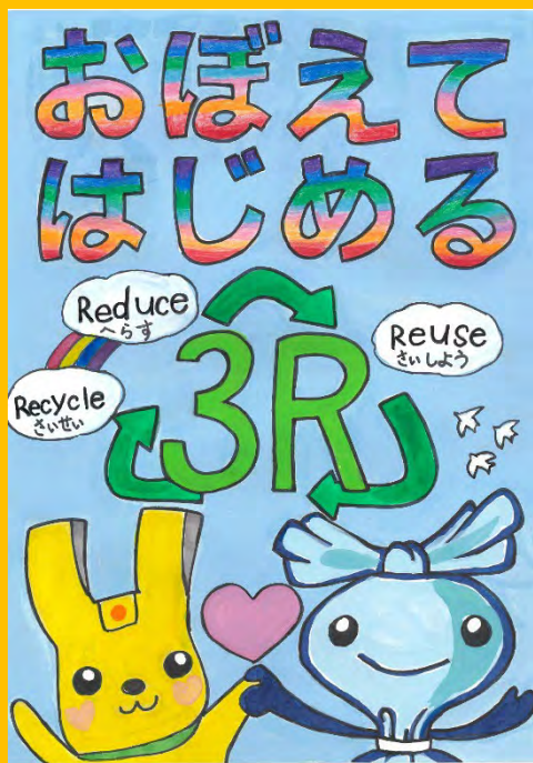
令和6年度 準大賞作品(小学校低学年の部)