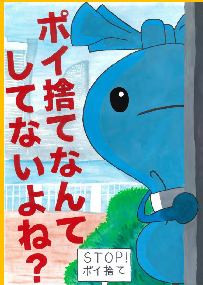
令和6年度 大賞作品(中学生の部)

子どもらしい自由な発想や創造力で環境にやさしい行動を市民の皆様に訴えるポスターを描いてもらい、横浜市の環境施策の広報啓発で活用すること、また、ポスター制作を各学校で授業に取り入れ、夏休みの課題等とすることで、児童・生徒のみなさんがこれらのテーマに向き合い、環境問題に関する基礎的な知識を身につけるとともに、その解決に必要な行動を自らが考え、実践するきっかけとすることを目的としています。