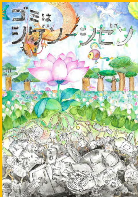
令和6年度 準大賞作品(小学校高学年の部)