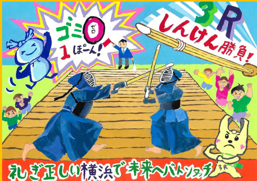
令和6年度 大賞作品(小学校高学年の部)

令和7年度ポスターコンクールにご賛同いただける企業様からの御支援をお待ちしております。 御協賛いただける企業様には、特典メニューを御用意しております。詳細については、次ページ以降をご覧ください。