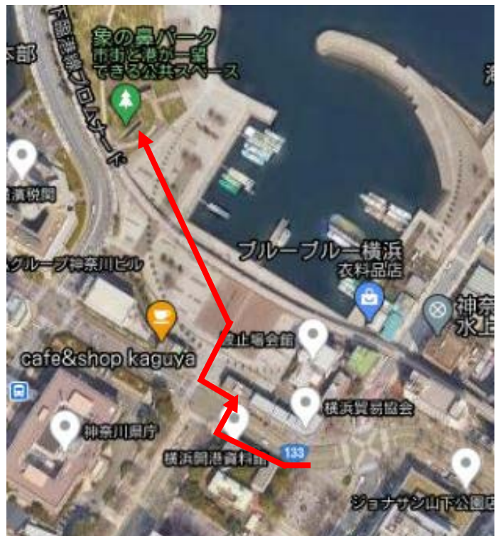
採火場所（開港広場前）～採火式会場（象の鼻テラス）までのルート （約 300m、徒歩約 5 分程度）