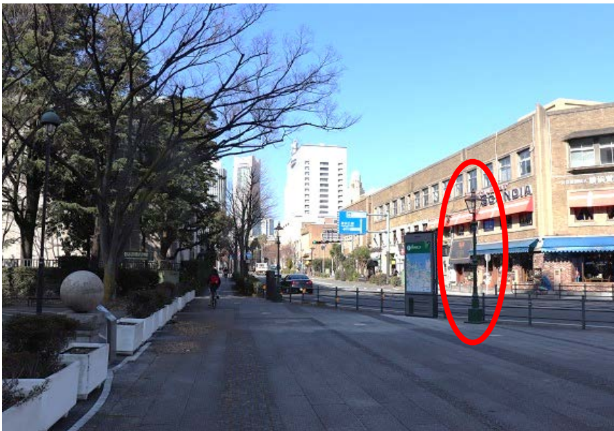
採火場所（丸が採火するガス灯）