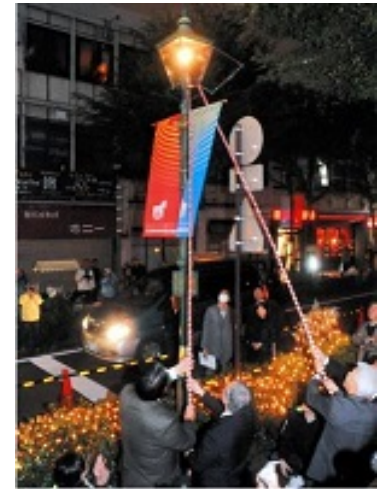
【イメージ】ガス灯からの採火 参考：ガスライトフェスティバル