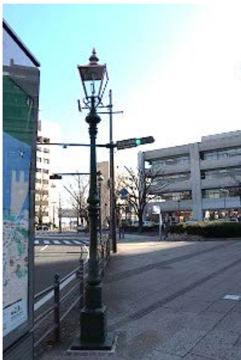
採火するガス灯アップ