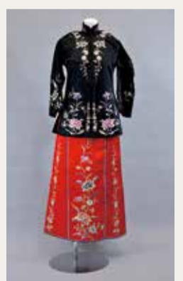
横浜華僑女性の婚礼衣装 1940年頃(廣東會館俱樂部寄贈・横浜ユーラシア文化館蔵)▲