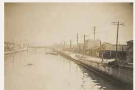
新吉田川(護岸工事完成後)▲