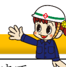
道路局マスコットキャラクター ミチルちゃん