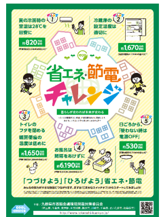
キャンペーンポスター

◇九都県市は温暖化対策に資する「賢い選択」を促す国民運動「COOL CHOICE」に賛同しています。