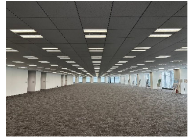
みなとみらいグランドセントラルタワー