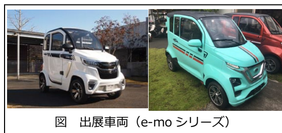
図 出展車両 (e-mo シリーズ)