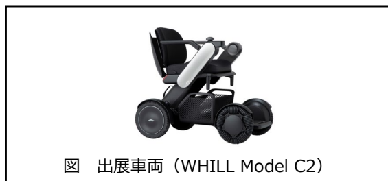
図 出展車両 (WHILL Model C2)