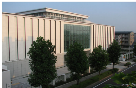
アートフォーラムあざみ野