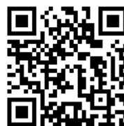
STYLE100 Instagram アカウント

https://www.instagram.com/style100_yokohama