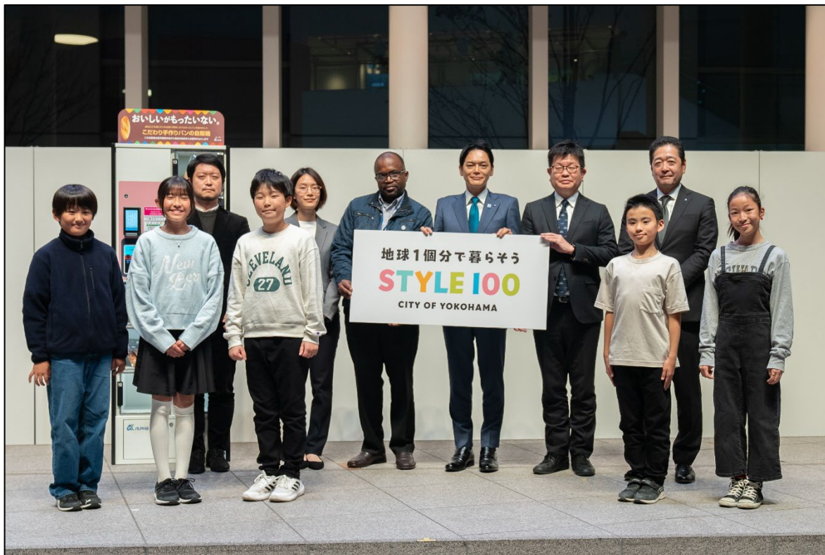
12月5日（木） STYLE100 発表会