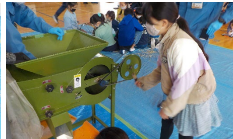
③唐箕（とうみ）にかける様子