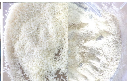
⑥精米（左）と米ぬか（右）