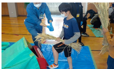
①脱穀機にかける様子