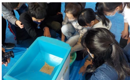
⑤精米機にかける様子