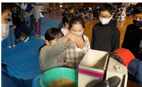
④籾摺り機にかける様子