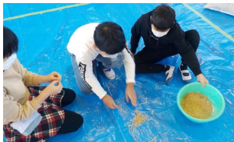
②籾（もみ）と藁（わら）を分別