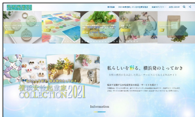
昨年度のオンライン展示会 WEBサイトイメージ