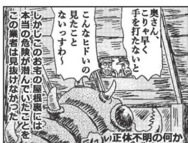
悪質業者は屋根や床下などの危険をことさらアピールし高額な請求をします

「近所で屋根工事をしている」「無料で点検してあげる」と突然来訪し、不安をあおって高額な工事契約をさせる手口がある 無料と言われたり、不安をあおられても、見知らぬ業者を ●屋根に上げない! ●その場で判断しない! 訪問販売の点検商法トラブルでは、火災保険を使用した修理を持ちかけるケースや、屋根工事のほか外壁・床下工事・シロアリなどがある 屋根修理をもちかけられても安易に契約せず、家族や知人に相談し、複数の業者から見積りをとる 困ったら消費生活総合センターに相談