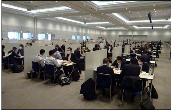
令和5年度に実施した「九都県市合同商談会2024」の商談風景 (会場:パシフィコ横浜 アネックスホール)

首都圏産業の国際競争力の強化を図るため、平成20年度から九都県市(埼玉県、千葉県、東京都、神奈川県、横浜市、川崎市、千葉市、さいたま市、相模原市)が連携して合同商談会を開催し、今回で17回目を迎えます。