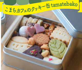
こまちカフェのクッキー缶 tamatebako