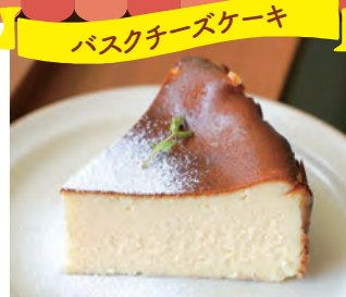
バスクチーズケーキ