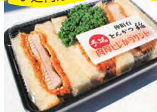
手延肉厚ヒレかつサンド