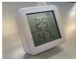
室内温湿度測定機器