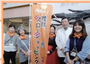
栄区 スローショッピング