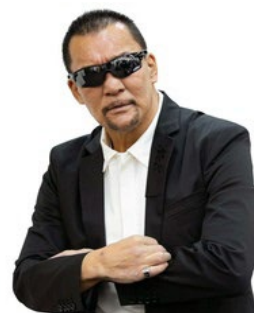
プロレスラー 蝶野正洋氏