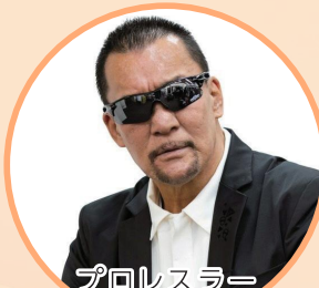
プロレスラー 蝶野正洋氏