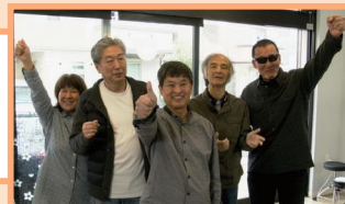
GRASP ストロベリーパラダイス