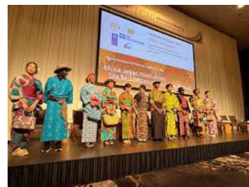
ファッションショーイメージ

場所：クイーンズスクエア横浜 クイーンズサークル （西区みなとみらい2丁目3番）