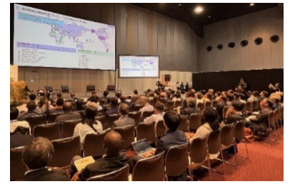
昨年10月に実施したセミナーの様子

日時：令和7年2月18日(火) 場所：Y-PORT センター公民連携オフィス GALERIO (ガレリオ) (横浜国際協力センター6階) 主催：YUSA 共催：横浜市国際局 申込方法：下記サイトより申込 https://www.yusa.yokohama/ (YUSA ホームページ) https://bit.ly/3BEhZII (参加申込)