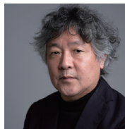
茂木健一郎 脳科学者