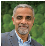
ラメシュ・スブラマニウム アジア開発銀行 セクターグループ局長