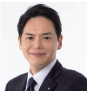
山中竹春 横浜市長