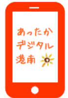
「あったかデジタル港南」 ロゴマーク

デジタルの力で区民の皆さまの利便性向上や区役所業務の効率化を進めることで、区民の皆さまと向き合う時間を増やし、これまで以上に「あったかい区役所」を実現します。