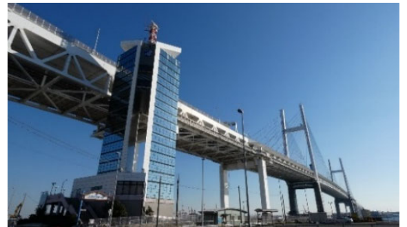
スカイラウンジの様子

HP： https://www.city.yokohama.lg.jp/kanko-bunka/minato/taikan/kengaku/sw201905.html