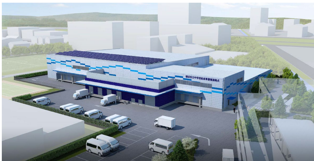
新設工場(横浜市中学校給食事業推進拠点)のイメージパース