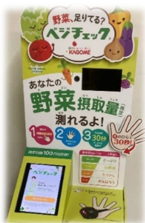
▲野菜摂取量測定で 食生活の改善のきっかけに！

野菜が迷路になったスタンプを台紙に押し遊んだり、給食調理に使用する大きな回転釜を体験してみたり、小さな子どもも楽しみながら、食をとおして学ぶことができます。