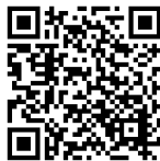
▲横浜市中学校給食 公式 Instagram