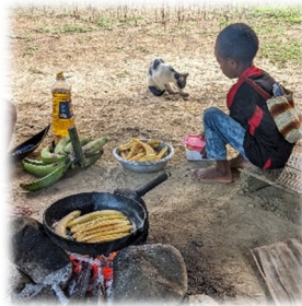
▲海外の食文化や生活の様子を写真とレポートで紹介しています