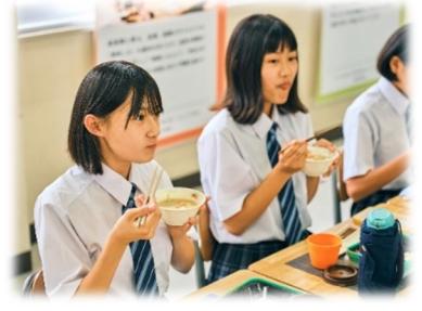
▲子どもたちも試食しています