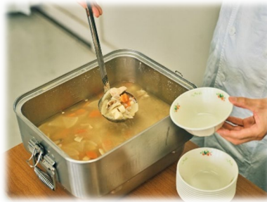
▲8年度から汁物が食缶提供になります