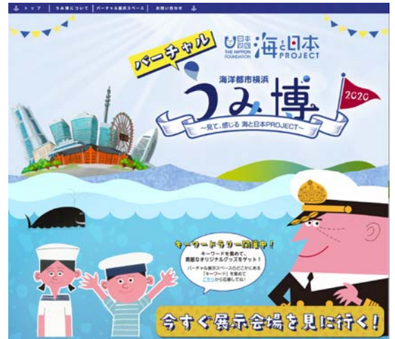
昨年のホームページ TOP（イメージ）