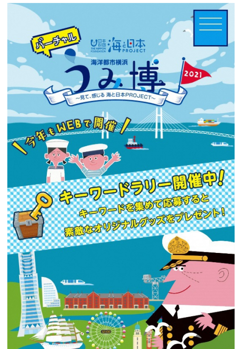
ホームページ TOP (イメージ)