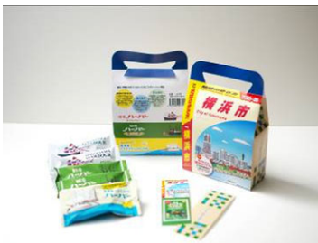
株式会社ありあけ×株式会社有隣堂 『地球の歩き方 横浜市』 オリジナルパッケージのコラボハーバー