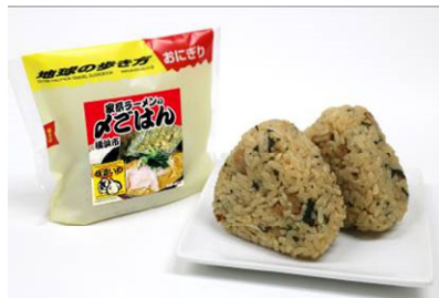
株式会社ミツハシ コラボおにぎり 「家系ラーメンのめごはん 味濃いめ」「ボトル米」