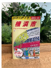
株式会社有隣堂 『地球の歩き方 横浜市版』 有隣堂限定オリジナルカバー