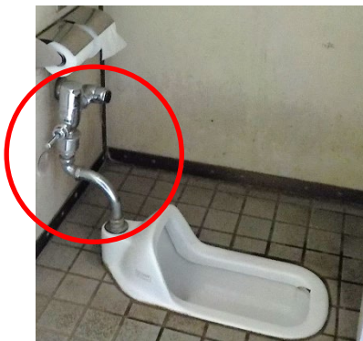
上山町公園 盗難前

公園の利用者からトイレのレバー等がなくなっているという通報（最初の通報：2月11日午後4時50分）が緑土木事務所があり、現地を確認したところ、給水管及びレバーが盗難に遭っていることが判明しました。その後、緑土木事務所が管理している公園トイレの状況を確認しましたが、他に盗難被害はありませんでした。