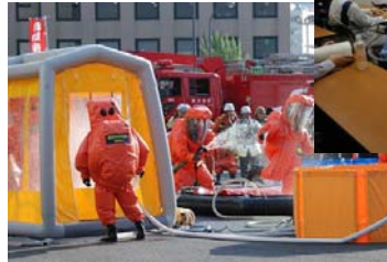
※以前実施したテロ災害対策訓練の様子