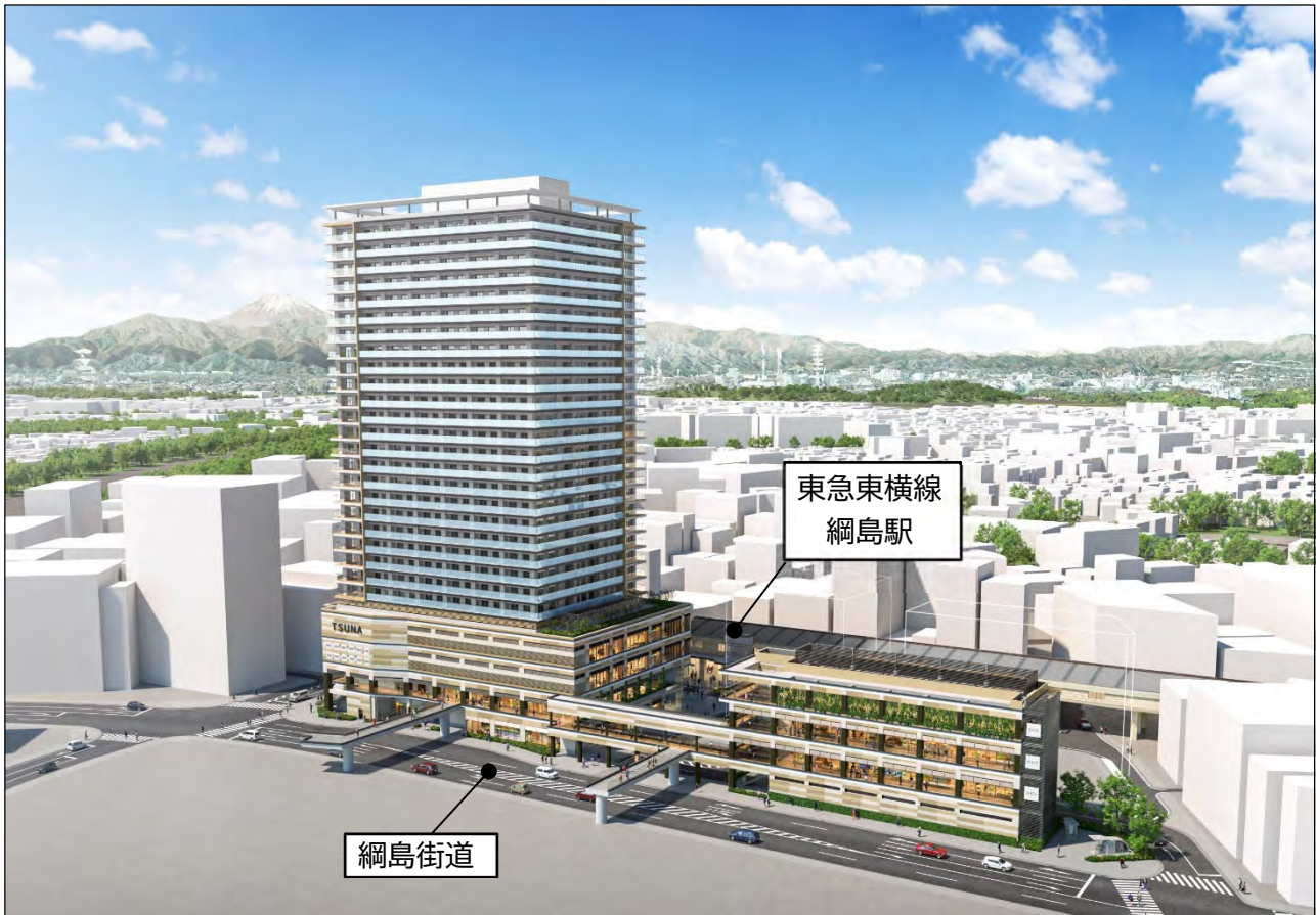
綱島駅東口駅前地区のイメージパース

※1 駅名称については、都市鉄道等利便増進法に基づく手続き等を行った上で正式に決定します。