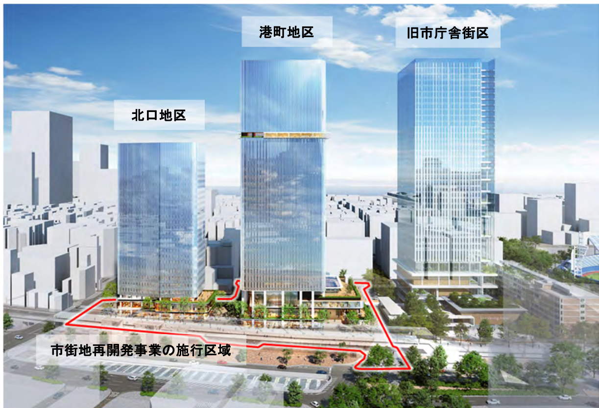
関内駅前地区のイメージパース

※ イメージパースに関する著作権は、関内駅前港町地区市街地再開発準備組合及び関内駅前北口地区市街地再開発準備組合に帰属するため、転載を禁止します。