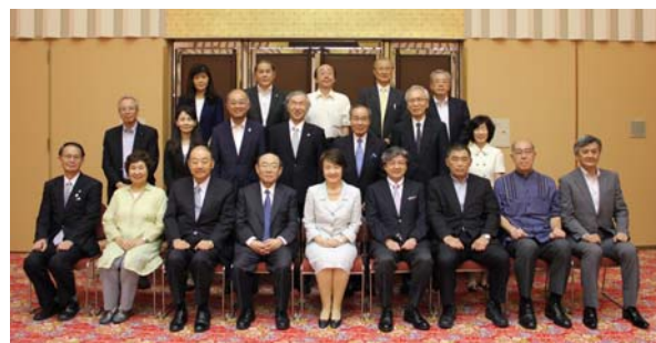
昨年度の代表者会議の様子

※取材にお越しいただける場合は、前日午後 5 時までに政策局大学調整課へご連絡ください。