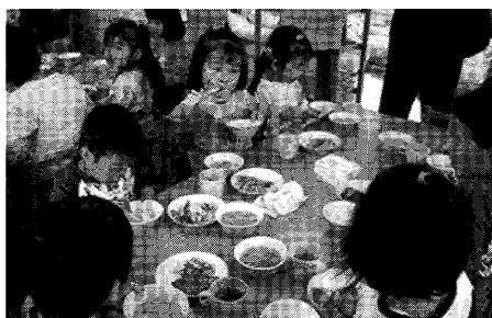
主食開始初日です！

横浜公立保育園保護者会連絡会で毎年実施している保護者アンケートの中でも、3歳児以上への主食提供は要望のトップに上げられていました。腐敗の心配、弁当作りが負担との意見が多く、弁当箱などの準備に時間とお金がかかることも要望理由のひとつでした。