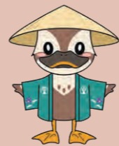
保土ヶ谷区マスコットキャラクター

2025年で4回目の開催となる星天フェア。 過去のイベントの様子はこちらからご覧いただけます!