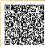
イベント詳細や台紙の ダウンロードはこちら