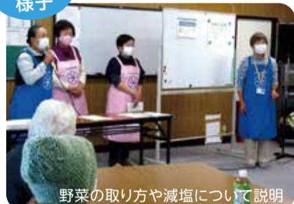
野菜の取り方や減塩について説明 (活動例:地域での食生活についての講座など)