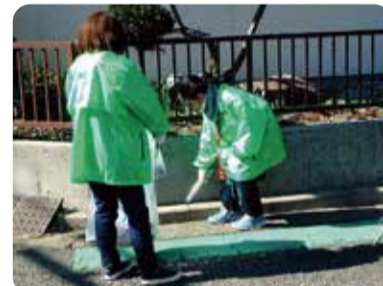
みんなで道路のごみを回収しています