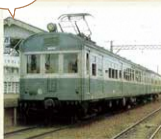
(区制90周年記念誌より)