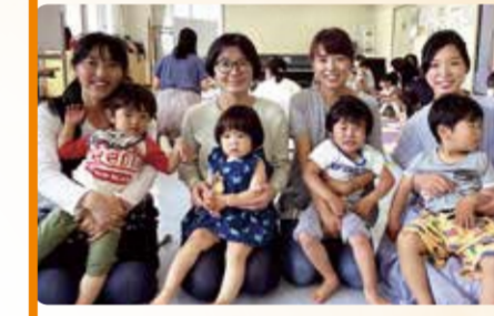
サークル代表者の皆さん