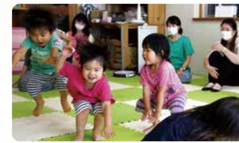
リトミックでかえるピョンピョン

子どもが同い年の知り合いが増えるし、イベントも楽しくて、いつも参加しています! 一時預かりがあるのも助かります!