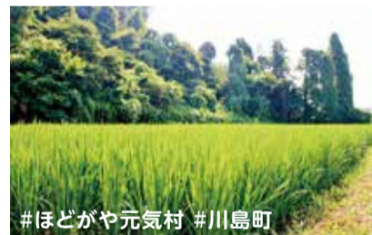
#ほ도가や元気村 #川島町