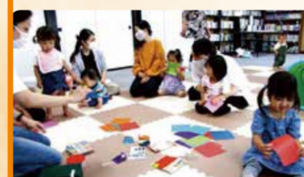
折り紙で工作(子育てサロン ピッコロ)