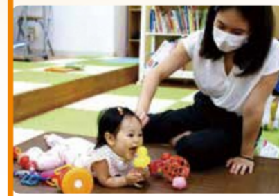
静かなところでのびのび遊べます 絵本もたくさんあります!