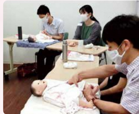
ベビーマッサージの演習