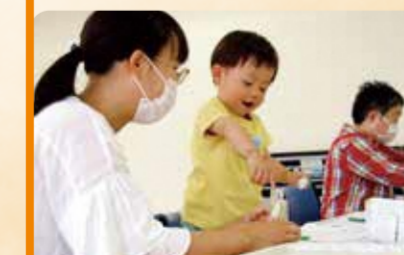
地域のボランティアさんと一緒にハーバリウム作り