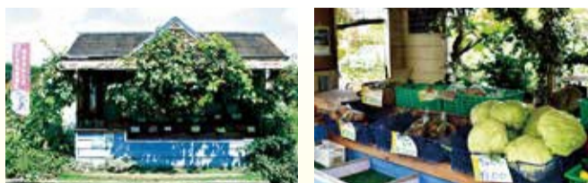
年間約50種類の野菜が並びます!