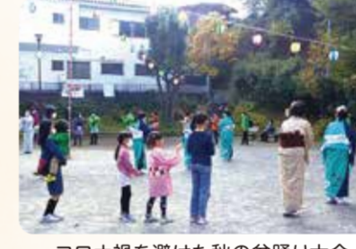
コロナ禍を避けた秋の盆踊り大会(瀬戸ヶ谷自治会)