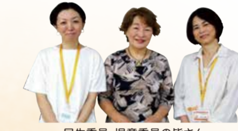
民生委員・児童委員の皆さん