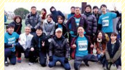
多くの社員が参加したかるがもファミリーマラソン大会

*Y-SDGs:SDGs達成に向けて取り組む企業・団体などを、横浜市が認証・支援する制度