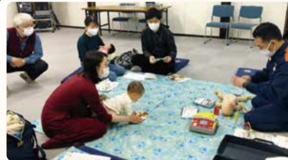
消防士による救命講習(権太坂境木自治会館)