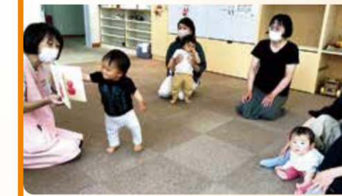
読み聞かせ(西谷地区センター)