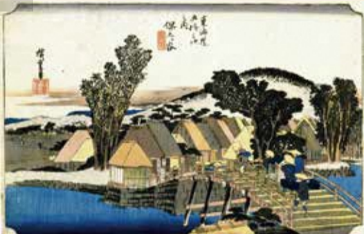
東海道五十三次之内 保土ヶ谷新町橋 (横浜市歴史博物館蔵)