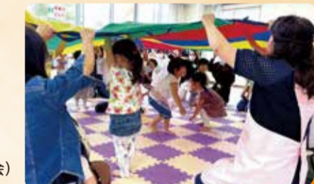
パラバルーン(常盤台あそびの会)