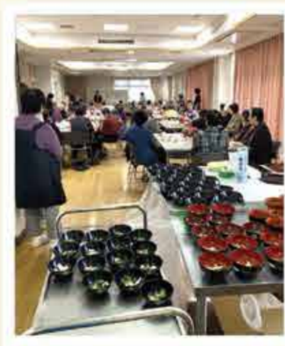
民生委員活動のイメージです。

今日は私の地区の町内会が主催するお食事会のお手伝いに行きます。今年も参加する皆さんが喜んでくれるといいな!