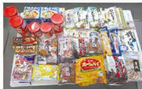
皆さんにご寄付いただいた食品の一例