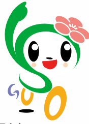
磯子区 マスコットキャラクター 「いそび」