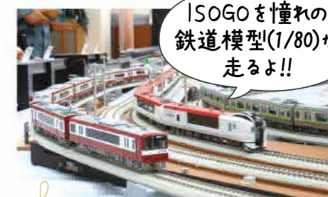
ISOGOを憧れの鉄道模型(1/80)が走るよ!!