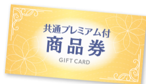
画像はイメージです