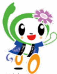
磯子区 マスコットキャラクター 「いそっぴ」