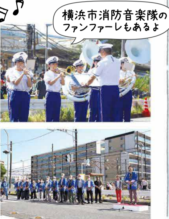
横浜市消防音楽隊のファンファーレもあるよ