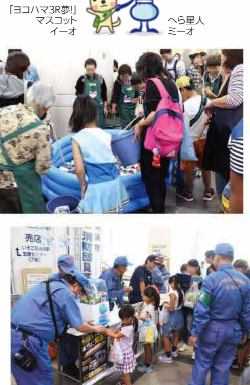
ゴミ分別ゲームなど