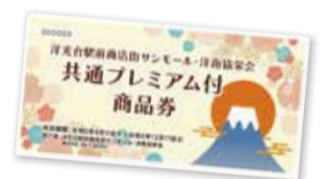
画像はイメージです