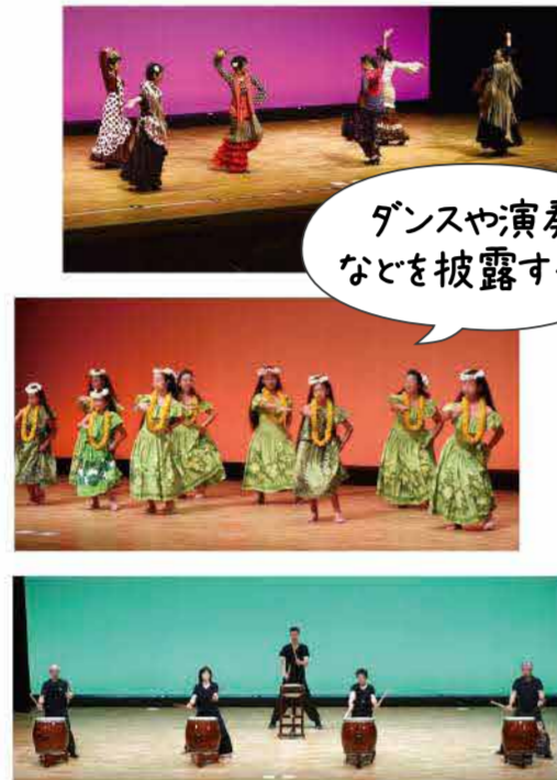
ダンスや演奏などを披露するよ