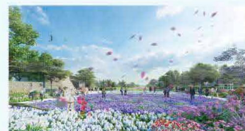
※イメージ図

GREEN x EXPO 2027 2027年国際園芸博覧会 GREEN x EXPO 2027は、国際的な園芸文化の普及や花と緑のあふれる暮らし、地域・経済の創造や社会的な課題解決への貢献を目的に開催されます。今年度は、機運醸成として積極的な広報PRを展開します。