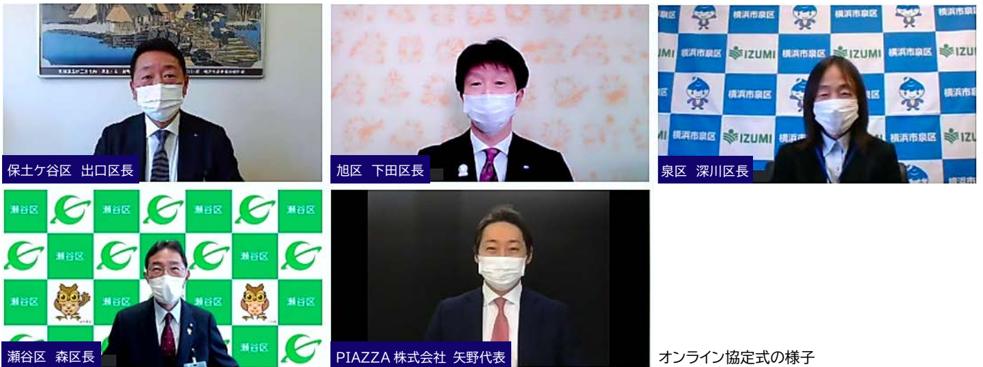
オンライン協定式の様子

また、ピアッツァの主な利用者は子育て中のファミリー層であることから、子育て支援ツールとしても活用いただくことで、子育てにやさしい、魅力あるまちづくりを進めていきます。