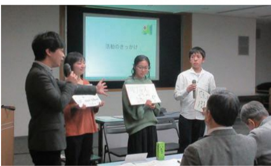
アクションポート横浜の皆さんによる事例紹介の様子

令和元年度は、新しい取組として、NPO法人アクションポート横浜*と地域協議会との意見交換の場を設けました。