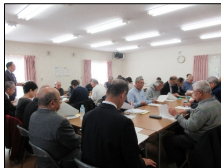
従来の対面式の会議