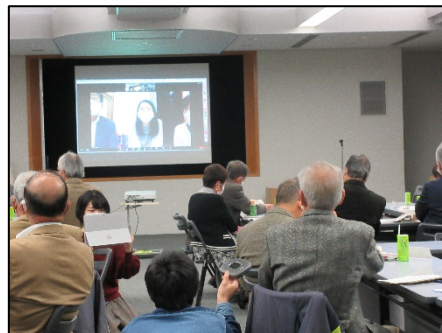
オンラインを活用したウェブ会議

地域や事業者による様々な活動や交流が途絶えることなく継続できることを目指します。