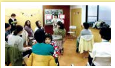
地域デビュー講座の様子 「何か始めたい」ママでいっぱい!

ふと見た広報よこはまで募集していた『地域デビュー講座“ママでもない妻でもない 私の居場所づくり”』に参加。