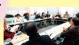
「夢プラン応援隊」で、「地域づくり大学校」同窓会を開催しました。地域の仲間たちと夢の実現に向けて!

活動を通して離れた世代からの学びが刺激となり、知らなかった世界を新鮮に感じ、仕事も私生活も充実した毎日を送り、最高です!!