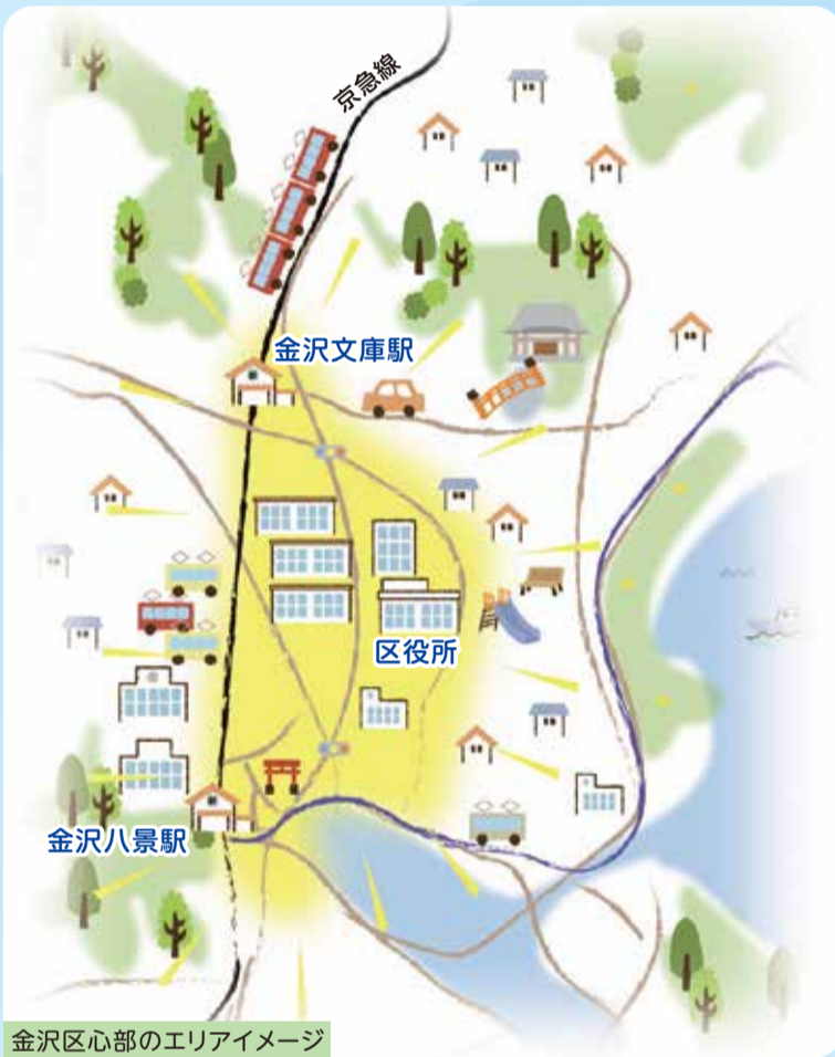
金沢区心部のエリアイメージ