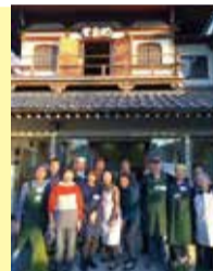
龍華寺(洲崎町)で定期的に開催している地域の居場所「わっか」で仲間たちと

今は地域の中で「コーヒーと笑顔を届ける」ボランティア活動を通じてさまざまな方と出会い、会話も弾んでいます。