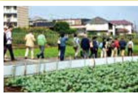
「地域づくり大学校」講座の様子 地域の魅力を再発見!

修了後、卒業生で金沢区をより良くしたいとの思いから「夢プラン応援隊」を立ち上げる。