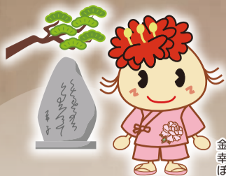
金沢区 幸せお届け大使 ぼたんちゃん