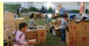
フォーラムKANAZAWA2019で開催したブース「段ボールであそぼう♪」は、子どもたちに大人気!

活動を通してたくさんの出会いがあり、それは一つ一つ大切なものになりました。活動していてよかったと実感しています。