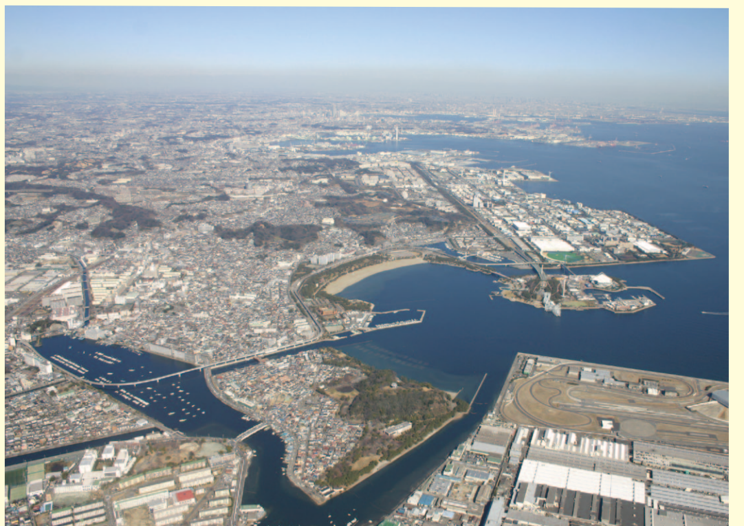
平成20年(2008年)撮影 ヘリコプター 「はまちどり」より