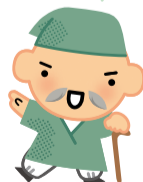
▲イメージキャラクター 健康ほうし君