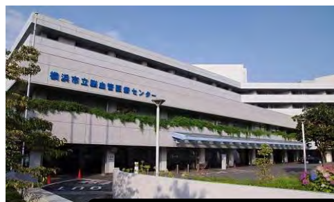
脳卒中・神経脊髄センター