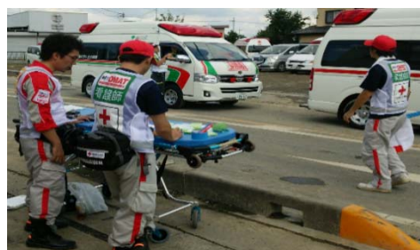
【台風18号時の救護活動(茨城県常総市)】

横浜市病院事業会計分の経常収支では、現金支出を伴わない減価償却費のうち一部が、損失として計上される仕組みです。