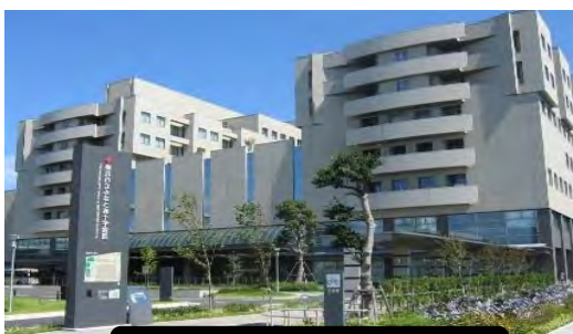
みなと赤十字病院