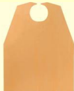
ティスポ食食用 エフロン