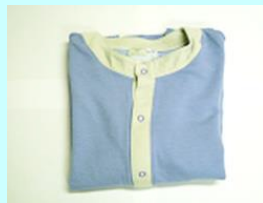
室内着上衣 【ラベンダー:冬用(長袖)・マスタード:夏用(半袖)】