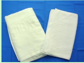
バスタオル・フェイスタオル