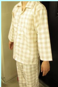
パジャマ (ベージュ)