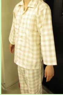
パジャマ (ベージュ)