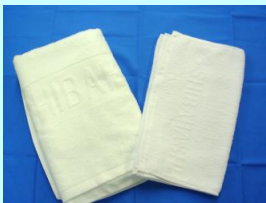
バスタオル フェイスタオル