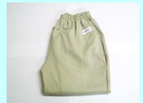
室内着パンツ 【夏冬兼用(長スボン)】