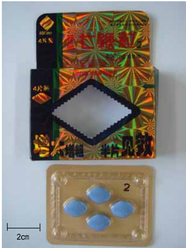
写真2 B区からの商品「七鞭粒」 (残品ではなく参考品)