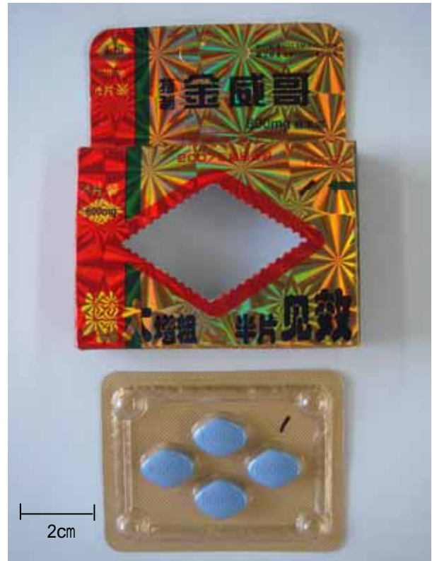
写真3 B区からの商品「金威哥」 (残品ではなく参考品)

最近、このような強壮・強精用健康食品中に血糖降下薬が添加されている事例がいくつかの都市で報告されており、海外では死亡事例も出ています。また、一見同じ商品でも含有成分が違うという事例は珍しくありません。過去に蟻力神(イーリーシン・ありんこパワー)についても、シルデナフィルが検出されたり、されなかったりということがありました。今回被害にあった人は、現地で売られている商品を服用したということで、お土産にも注意が必要です。