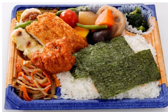
<ハマの元気ごはん弁当>