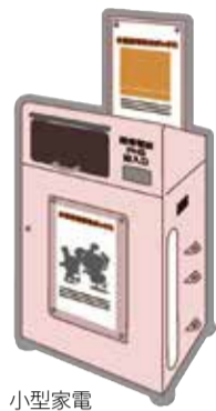
小型家電 回収ボックス

引っ越しで出た不要な小型の電化製品。大切な資源をごみにしないために、小型家電回収ボックスに出してリサイクルしませんか。